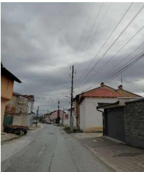
Слики 3 – 16. Слики од моментална состојба на улиците во с.Врапчиште