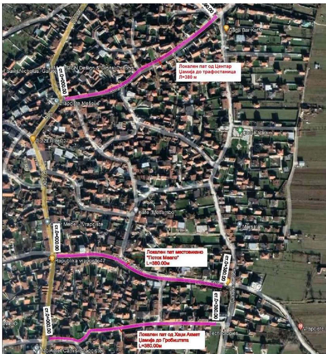
Слика 1 Локација на реконструкција на локални патишта во с.Врапчиште (розева боја)

дадена локација на проектот. Детален опис на страницата на проектот е даден подолу во следниот текст.